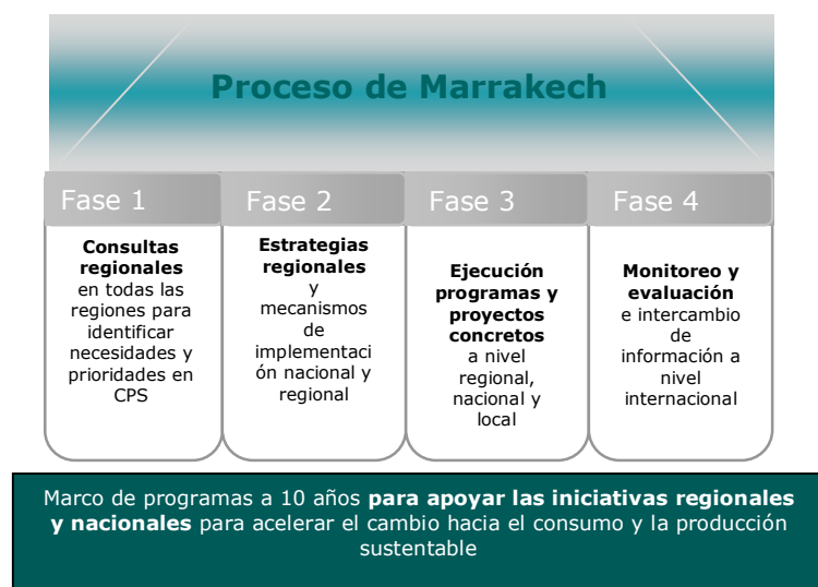
Figura 1. Fases o Áreas de Acción del Proceso de Marrakech

El desarrollo de estas etapas o acciones no es lineal ni tiene un orden cronológico. Las fase o áreas de acción pueden llevarse a cabo de forma paralelo, y son más bien parte de un proceso continuo de revisión y fortalecimiento de estrategias y metodologías.