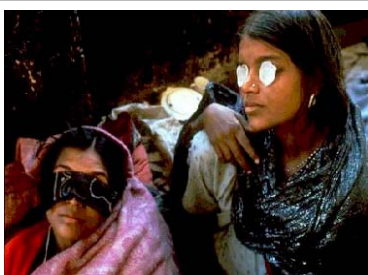
Bhopal, Índia - 1984