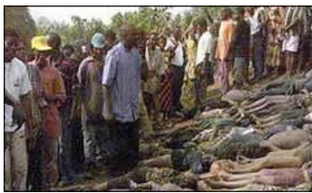
Lagos, Nigéria - 2002

Embora a maioria dos acidentes nunca seja reportada, alguns tornaram-se conhecidos do grande público.