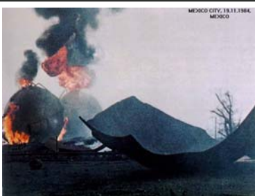
Cidade do México, México - 1984