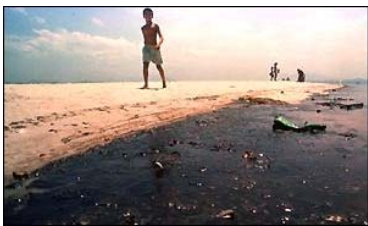
Baía de Guanabara, Brasil - 2000