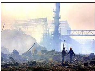
Toulouse, França - 2001